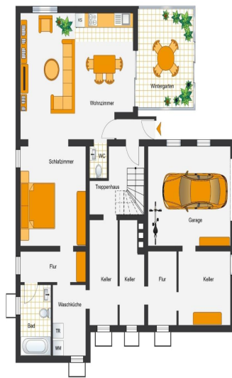
Wintergarten + Untergeschoss