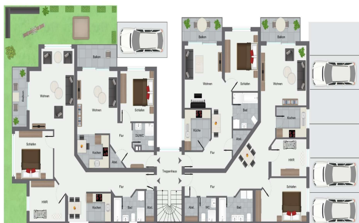
1. Obergeschoss/ 2. Obergeschoss