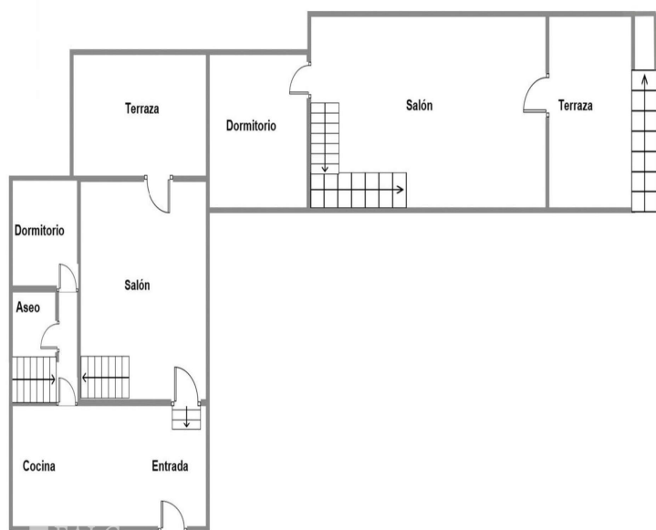
First Floor/ Primera Planta