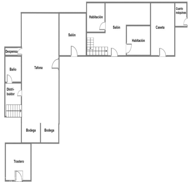
Ground Floor/ Planta Baja